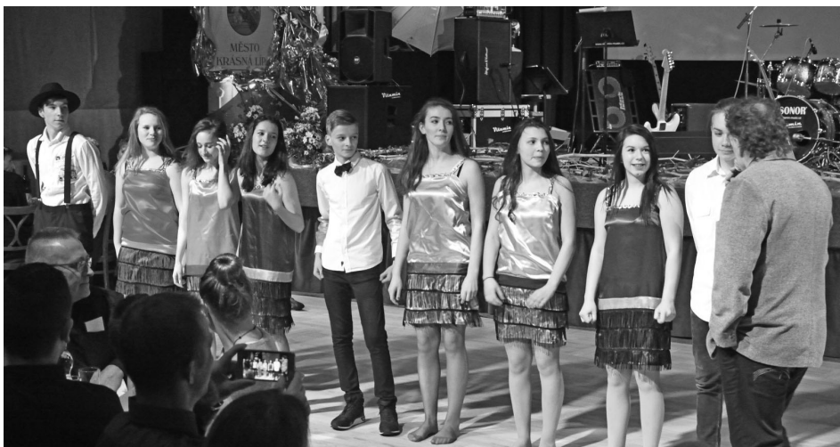
Team Beans v sobotu 19. ledna na Reprezentačním plese města Krásná Lípa, kde se skupina ujala předtančení a krátce nato vystoupila i na módní přehlídce.