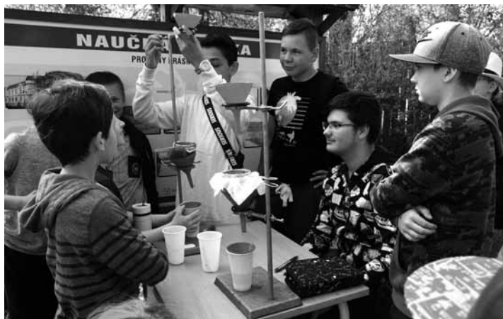
Ekostanoviště v areálu školy