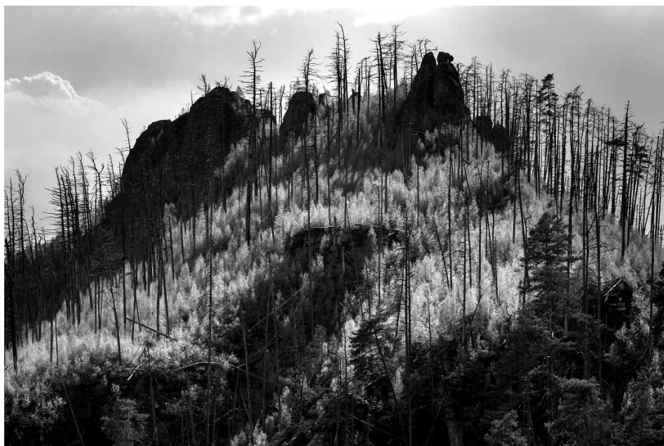
Požářiště u Jetřichovic s novým lesem

Co říci závěrem? Snad jen, že zbytečně ztrácíme čas, energii vymyšlením způsobu jak tuto kalamitu zastavit a utrácíme peníze na boj s kůrovcem. Boj, který za současného sucha nelze vyhrát. Je na čase si uvědomit, že člověk udelal chyby, změnil les ku své potřebě a les si teď bere zpět, co mu člověk vzal. Svou přirozenost! A ukazuje nám, že je silnější, že má svou moudrost. Je načase brát skutečnost s gradací kůrovce jako ohromnou příležitost. Příležitost naučit se žít s lesem a přestat mít snahu ho řídit a využívat. Lze jej užívat, nikoliv však využívat. My lidé jsme součástí přírody a měli bychom s ní souznít a nikoliv ji řídit. Je to, myslím, pro člověka velká lecke.