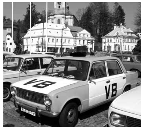
Fotografie ze srazu vozů Žiguli-Lada a Moskvic v krásnolipském náměstí 6. dubna 2019