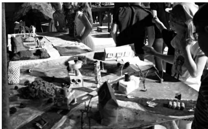
Výrobky zaslané do výtvarné soutěže na téma Voda v krajině si můžete prohlédnout v kině, kde jsou stále vystaveny. Všem zúčastněným v soutěži děkujeme.