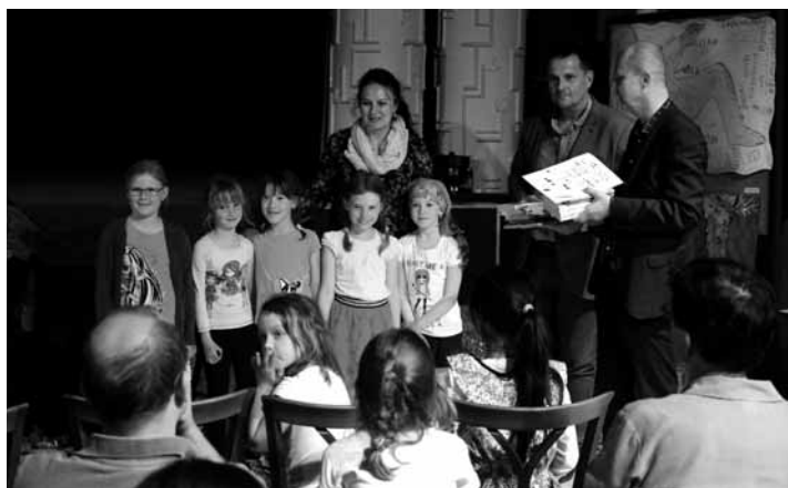
Fotografie z vyhlášení vítězů výtvarné soutěže