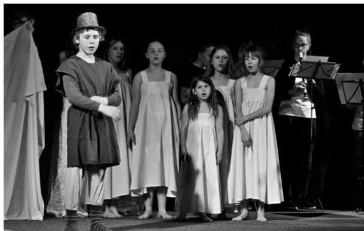
Představení ZUŠ Varnsdorf Voda voděnka