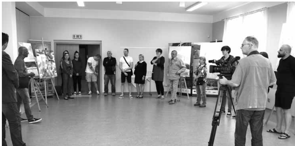
Vernisáž výstavy Moře, les aneb uvolněte se prosím, proběhla 8. července 2019 v Domě Českého Švýcarska. Výběr prací studentů 3. ročníku Katedry výtvarné kultury Univerzity J. E. Purkyně v Ústí nad Labem pod vedením Prof. JUDr. Vladimíra Franze jsme zde pak mohli vidět až do 19. července 2019.

Vladimír Franz nerozezněl varhany krásnolipského kostela poprvé, také jsme v Krásné Lípě měli možnost nahlédnout do jeho výtvarné tvorby. Výstava obrazů jeho studentů tak nabídla zajímavé pokračování – další pohled na Vladimíra Franze, tentokrát jako pedagoga.