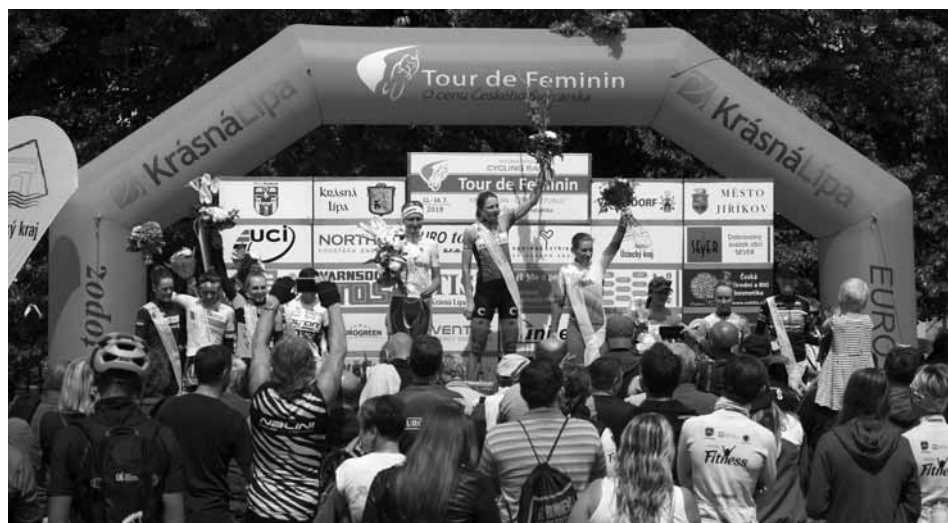
Zanedlouho po projetí závodnic cílem poslední etapy se na Křinicím náměstí konalo slavnostní vyhlášení, nejen této etapy, ale i celého závodu.