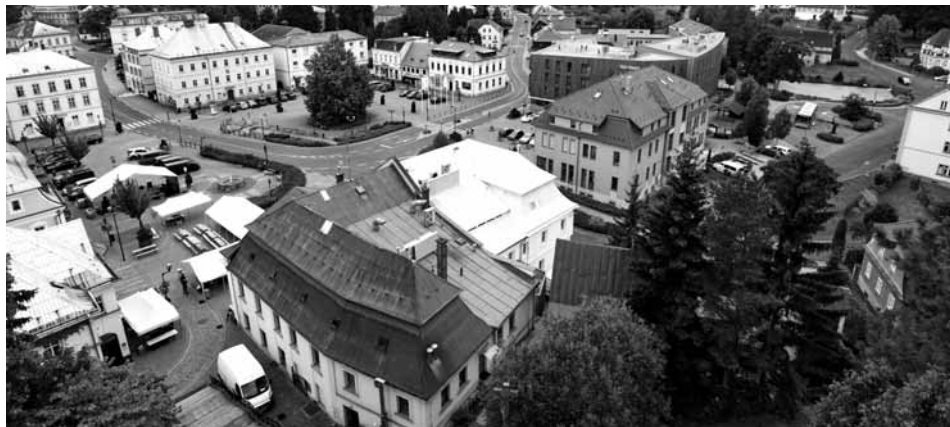
Krásnolipská nádhera v minulém roce. Rozhlédnout se z kostelní věže, jak slibuje plakátek, budeme mít i letos.

Tradiční hudebně-pivovarský festival, letos již k šestému výročí otevření Pivovaru Falkenštejn, se koná 3. srpna 2019 na Křínickém náměstí v prostoru před pivovarem. Hudební program začíná ve 14.00 a doplní ho narážení speciálního piva, grilování, stánek BBCider a Bohemian coffee house. Chybět nebude ani možnost na Krásnolipskou nádheru pohlédnout z ptací perspektivy, a to díky otevření kostelní věže. Vstupné na festival je zdarma.