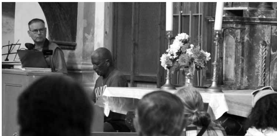
Vernisáži předcházeli varhanní koncert Vladimíra Franze v kostele svaté Máří Magdalény.