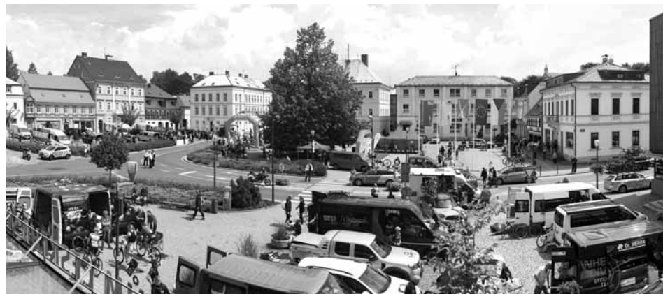
První etapa a současně i celý závod odstartoval v Krásné Lípě. Byl zde i cíl poslední páté etapy (na fotografii).

Na start letošního ročníku Tour de Feminin se ve čtvrtek 11. července v Krásné Lípě postavilo 158 závodnic z 28 týmů a závod rozdělený do 5 etap se jel až do neděle 14. července. Do poslední etapy odstartovalo 129 závodnic a cílem jich nakonec projelo 120. Celý závod měřil 399,9 km a celková průměrná rychlost vítězky byla 36,4 km/h. (Zdroj: www.tourdefeminin.com )