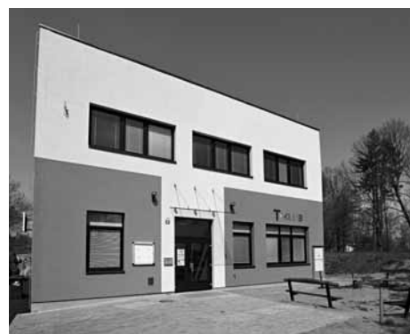
V letech 2018 a 2019 celkově zrekonstruovaný, o patro vyšší a nově vybavený T-klub nad sídlištěm.

Umožní to kromě jiného do ČAS vstoupit, čerpat metodickou podporu, mít levnější vzdělávání pro zaměstnance, rozvíjet kvalitu služby a účastnit se nějakých projektů.