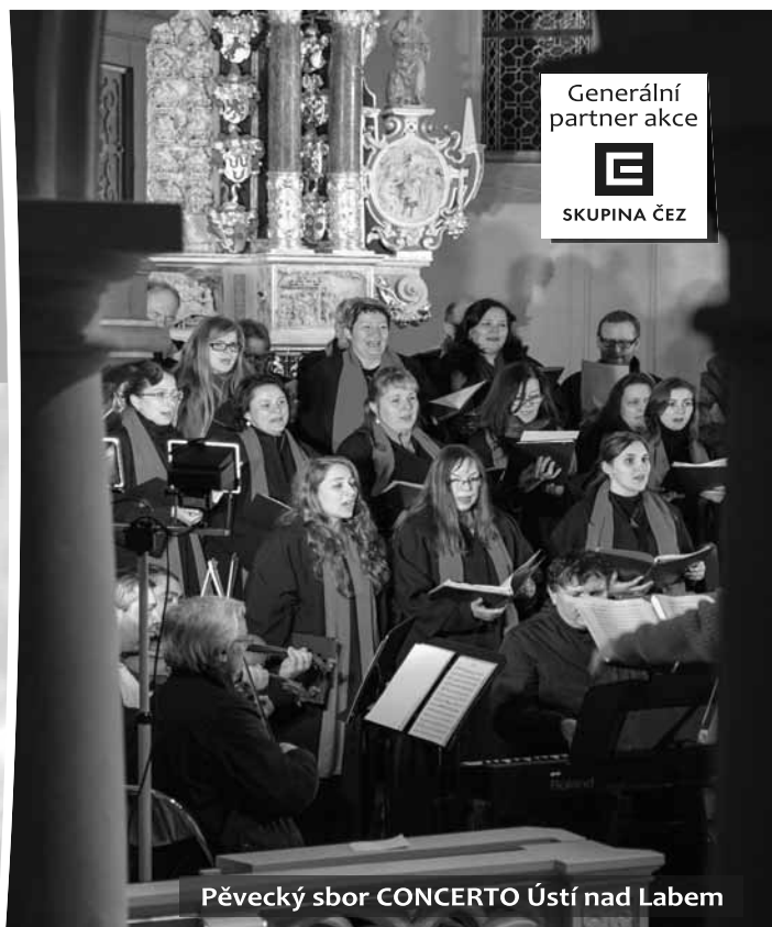
Pěvecký sbor CONCERTO Ústí nad Labem

Změna programu vyhrazena. Na akci jsou pořizována foto a videa. Ta mohou být použita, zveřejněna či poskytnuta pro účely propagace města Krásná Lípa. | www.krasnalipa.cz