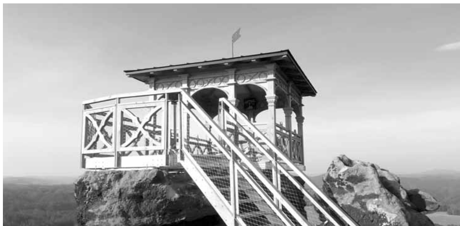
Nový altán na Mariině vyhlídce je inspirován altánem původním, který byl na skále vystaven v roce 1856.

Publikováno z oficiální webové stránky NP České Švýcarsko a CHKO Labské pískovce ( https://www.npcs.cz )