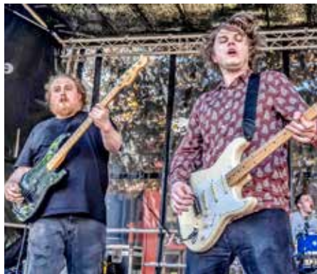
The Zac Schulze Gang

22. 6. Slavnosti města Varnsdorfu rozhodně letos stojí za to, abyste podrobně prozkoumali jejich program. Ještě než 24. 6. vypukne hlavní den slavností, můžete si ve větším klidu užít na prostranství U Věžičky ve Varnsdorfu koncert dvou mimořádných kapel. Od sedmi zahraje The Zac Schulze Gang (Velká Británie), jedna z nejlepších mladých kapel Anglie nominovaná při letošních Britských bluesových cenách na nejlepší mladou kapelu a na koncert roku! Směs blues, rocku a coververzí od 50. let do současnosti. Od devíti pak vypuknou vzpomínky na legendární album Kuře v hodinách v podání Flamenco Reunion Session – i s Pavlem Fořtem a Gumou Kulhánkem!