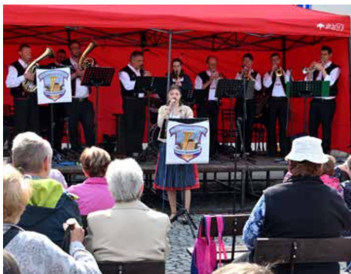
Příjemnou atmosféru sobotního dopoledne umocnilo i vystoupení dechové hudby z Budyšina