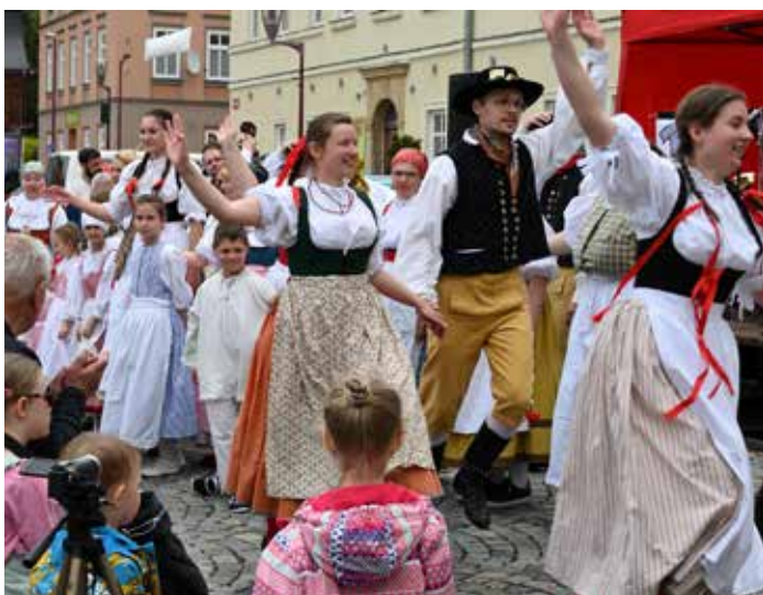
Během slavnostního zahájení nové venkovní výstavy vystoupila celá řada řečníků, následovalo vystoupení folklorního souboru Dykta